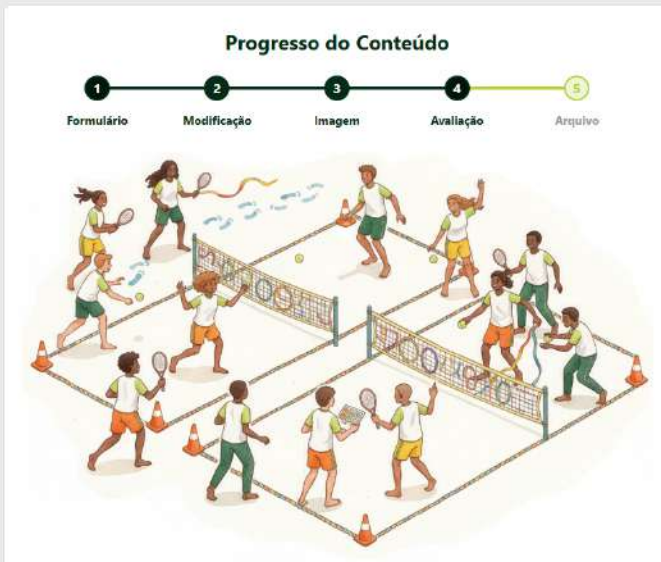
Construção da aula